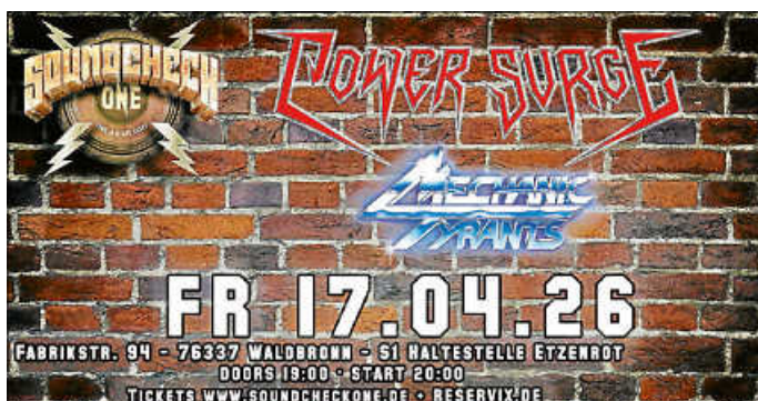
Plakat: Wayne Beselt

Mechanic Tyrants aus Nürnberg liefern kompromisslosen Speed Metal: roh, schnell und energiegeladen. Seit ihrer Gründung 2021 haben sie mit der EP „ Manhattan “ und dem Album „ St. Diemen Riots “ eine eigene dystopische Welt geschaffen. Über 40 Clubshows im In- und Ausland sowie Auftritte bei Festivals wie Trveheim, Der Detze Rock!, Storm Crusher und Void Fest sprechen für sich. Gemeinsam mit Acts wie Exciter, Razor, Girlschool, The Dead Daisies und Enforcer haben sie sich als einer der spannendsten Speed-Metal-Acts etabliert.