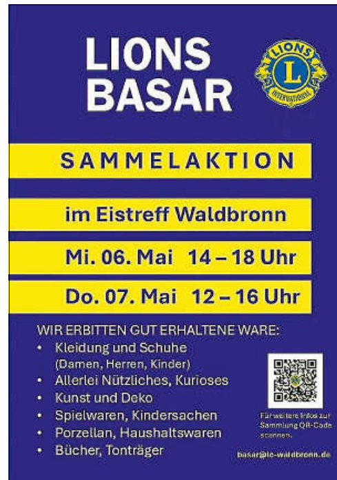
Sammelplakat: Lions Hilfe Waldbronn e.V.