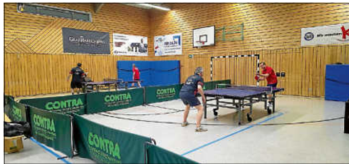
Beim Spitzenreiter TG Aue zu Gast

konnte im Einzel noch einen weiteren Punkt, zum Endstand 2:9 für Aue, gewinnen.