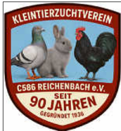
Logo: KLZV Reichenbach

Wir werden uns zu jeder Veranstaltung etwas Besonderes einfallen lassen. Lassen Sie sich überraschen.