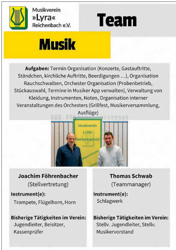
Plakat: Mv Lyra Reichenbach