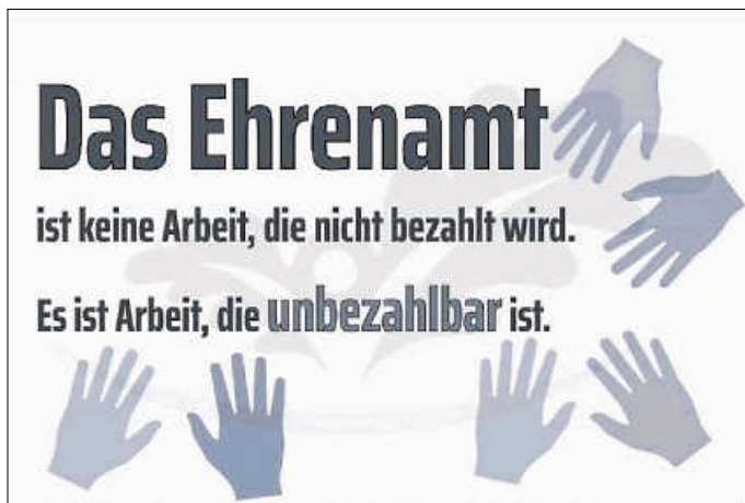
Plakat: Hospizverein KMW e.V.

Der Hospizverein KMW e.V. ist in unserer Region zuhause und begleitet hier Menschen in schwierigen Lebensphasen.