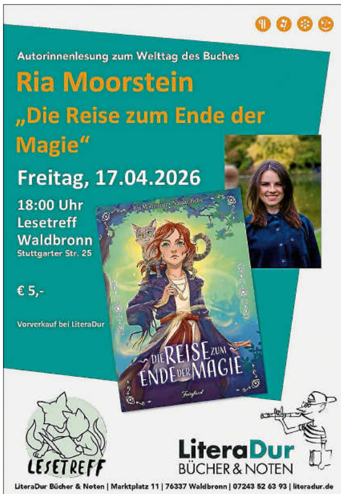
Plakat: LiteraDur Bücher & Noten

Magische Autorinnenlesung zum Welttag des Buches für Kinder ab der 4. Klasse (und Erwachsene)