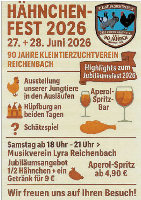
Hähnchenfest 2026 Plakat: KLZV Reichenbach

90 Jahre Kleintierzuchtverein Reichenbach / Hähnchenfest 2026 / Terminvormerkung