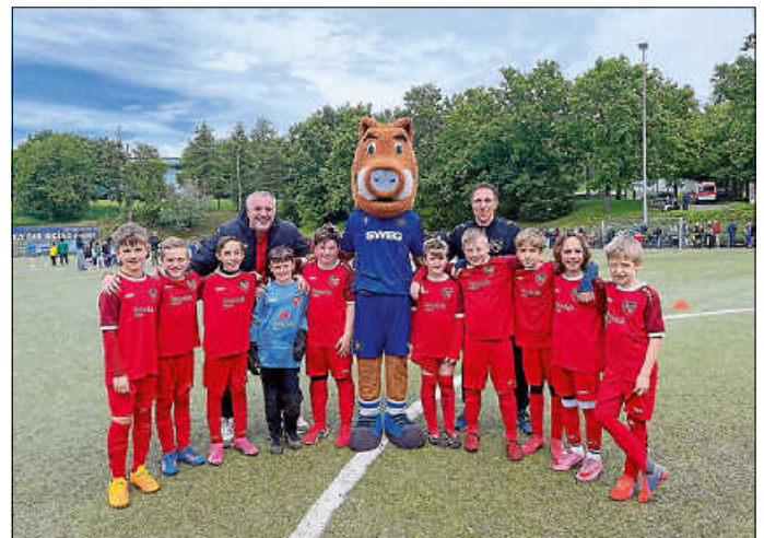
Unsere E 2

Vielen Dank an die treuen Fans und an alle Helfer:innen für die Unterstützung beim Heimspieltag!