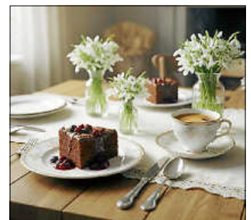
Senioren Café

Ihr Team vom Seniorencafé Wenn Sie einen Fahrdienst benötigen, melden Sie sich bitte bei Frau Müller, Tel.: 07243/3 58 98 99