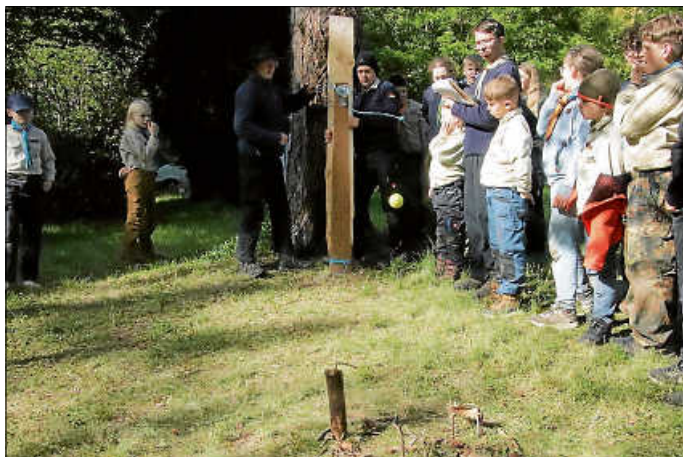
Ob der Ball wohl trifft?

In kleinen Gruppen machten sich die Pfadfinder ans Werk. Gegenstände aus der Natur durften sie einfach so verwenden. Zusätzlich konnten sie sich Material und Werkzeug erwerben, indem sie verschiedene Aufgaben lösten. Wer sich beispielsweise mit Wiesenblumen gut auskannte, konnte dafür einen Fäustel mitnehmen.