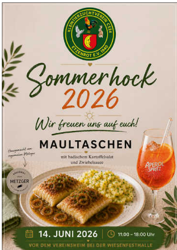
Plakat: KLTZV Etzenrot e.V.